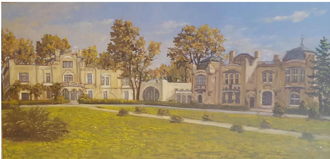
Maľba Abrahámskeho kaštieľa od Bilčíka (2016). Maľba vznikla na základe starej mapy (nákrese stavieb) a existujúcich fotiek samostatných stavieb.