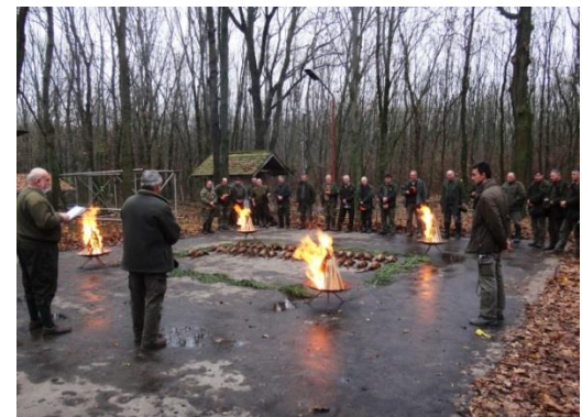
Záverečná bilancia poľovky. Horiace ohne na počesť ulovenej zveri. Žiaľ časy, keď počet ulovených bažantov či zajacov mnohonásobne prevyšoval počet poľovníkov sú nenávratne za nami.