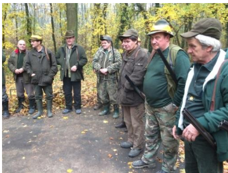
Počas nástupu pred začiatkom poľovačky.