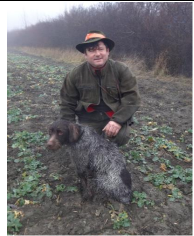
Dobry poľovny pes je neocenitelny pomocnikom kazdeho poľovníka.