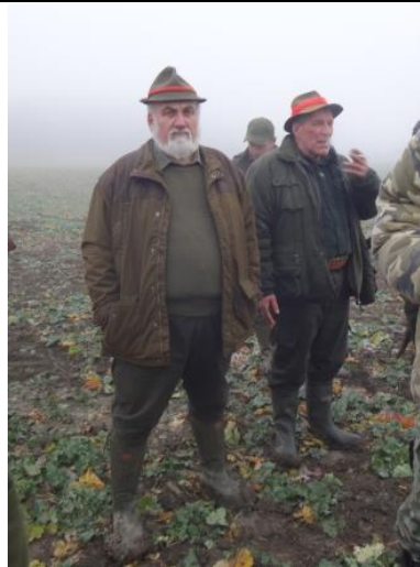
Poľovný hospodár riadi celý priebeh poľovačky.