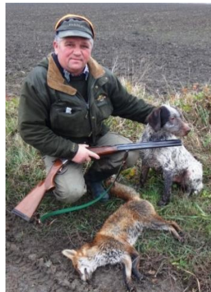
Aj na tejto poľovke sa podarilo uloviť líšku v Šarde.