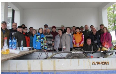
aj v pondelok, kedy sa na nej zúčastnilo 32 osôb, z toho 21 matičiarov.

29.4.2023 sa na základe výzvy Obce Abrahám organizovala brigáda na obecnom cintoríne, kosenie, zemetanie a vývoz trávnatého porastu do chotára. Z celkového počtu 34 účastníkov sa zúčastnilo 22 matičiarov. Brigáda pokračovala z dôvodu nepriaznivého počasia