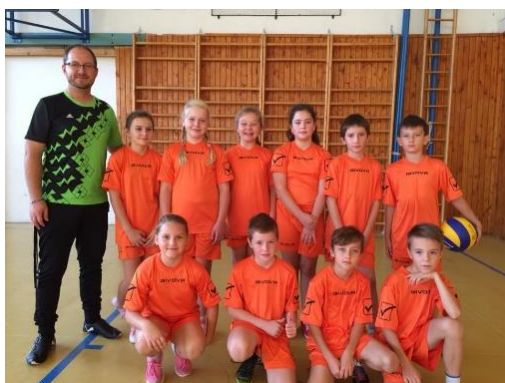
5. 11. 2018 – Turnaj vo vybíjanej – najmladší žiaci, obvodné kolo, v Galante: 3. miesto