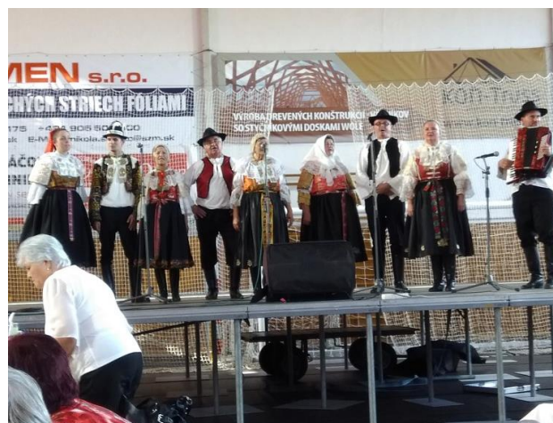
Pozdravili sme prítomných na stretnutí dôchodcov okresu Galanta