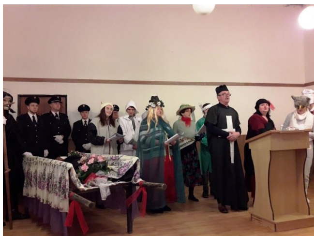
... basu sme už pochovali