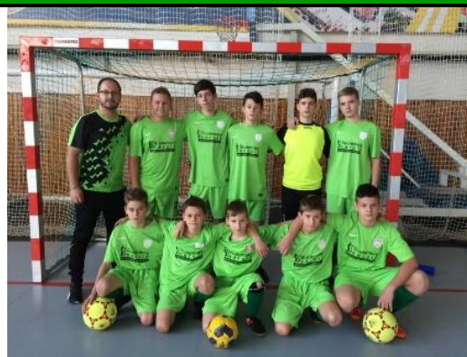
15. 11. 2018 – Turnaj vo futsale – starší žiaci, obvodné kolo, v Galante: 4. miesto