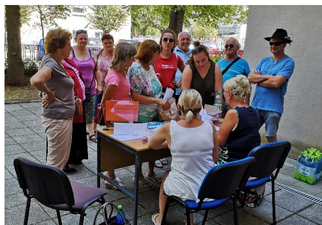
Matičné slávnosti v Martine – registrácia na naše vystúpenie