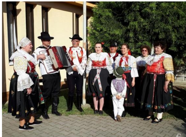
Deti zdobili, my sme spievali a pre hasičov zostala najťažšia úloha – postaviť máj