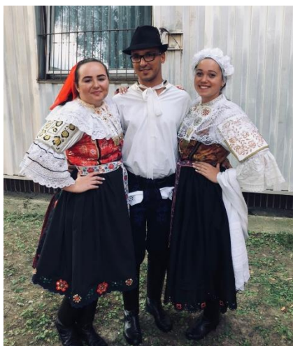
Prehliadka folklórnych a speváckych skupín z príležitosti Vavry zvrchovanosti v Galante