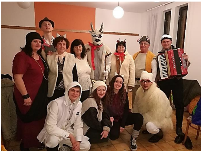
Dobrú náladu na našom plese ešte viac vyburcovala rozprávka O kozliatkach

Našu pestrú činnosť Vám predstavujeme na fotkách z vystúpení