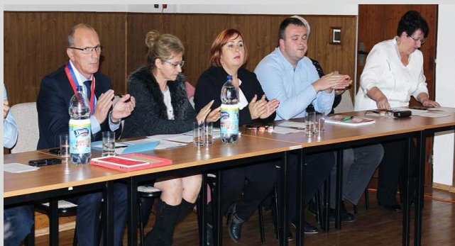
Z ustanovujúceho zasadnutia obecného zastupiteľstva