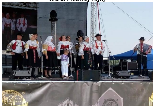
Friškofest v našej obci