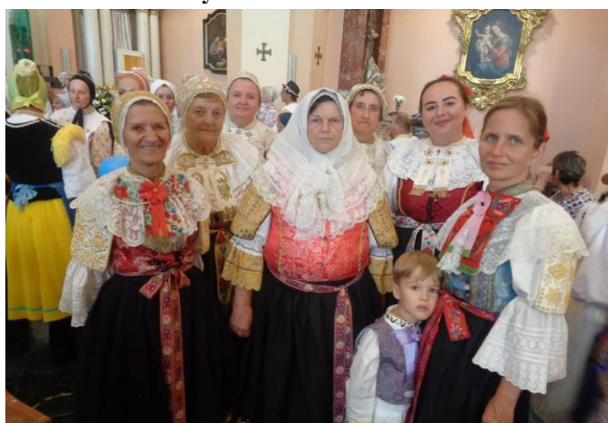
Deň „Slovenského kroja“ – Banská Bystrica