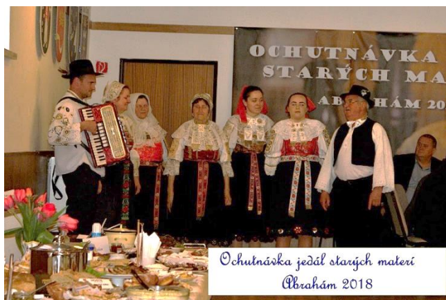
Ochutnávka jedál starých materi