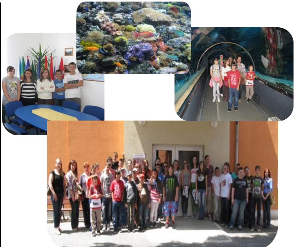
Žiaci a učители ZŠ M.Tareka v akcii v Maďarsku